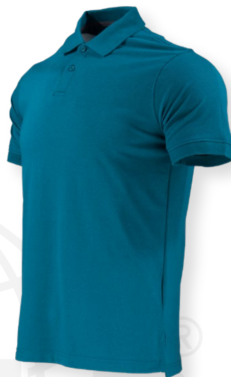
TABLA DE TALLAS